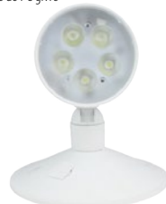
TL-EM003 (5W/ 7W)