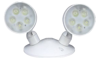
TL-EM002 (10W/ 14W)

Lentille de PC incolore et réflecteur d'aluminium