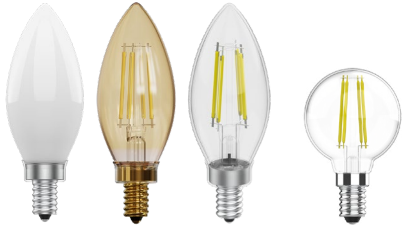
B10 blanc laiteux

Plage de température d'exploitation de -25 °C ~ +45 °C