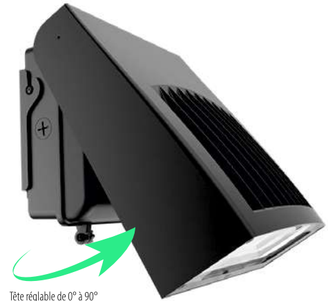
Tête réglable de 0° à 90°